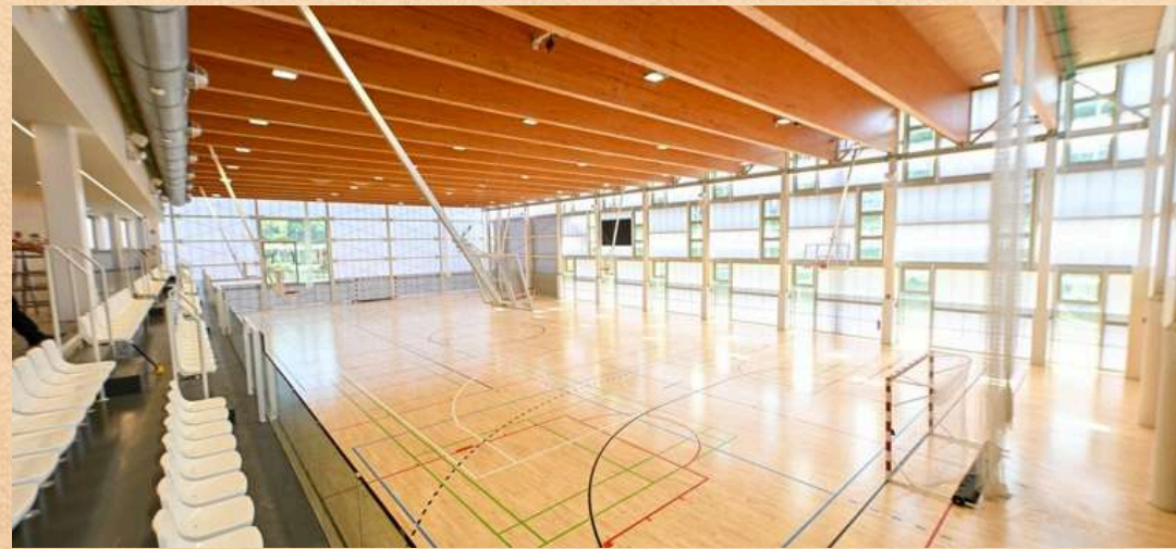
Pavelló Municipal l'Illa C/ Numància 142, 08029, Barcelona

L'activitat es realitzarà en les següents instal·lacions: