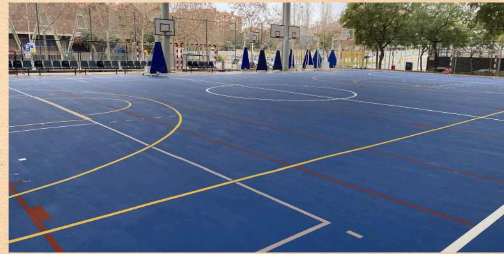
CEM Aristides i Maillol C/ Marti i Franques, 08028, Barcelona

*En funció del nombre d'inscripcions, les instal·lacions poden variar. Més endavant rebreu un correu amb tota l'informació d'on realitzarà l'activitat el seu fill/a.